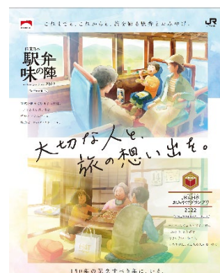
メインビジュアル