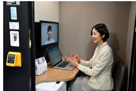
STATION BOOTH ご利用の様子