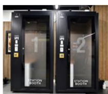
▲ STATION BOOTH