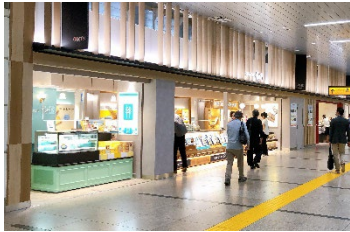
【エキウト大宮 ノース】