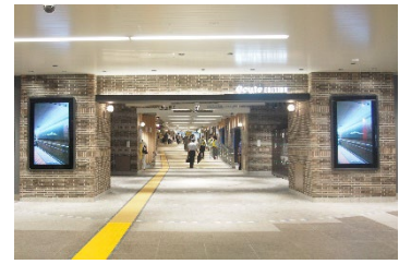
【エキウトエディション横浜】