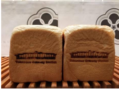
【高輪ゲートウェイ駅限定 本食パン イメージ】