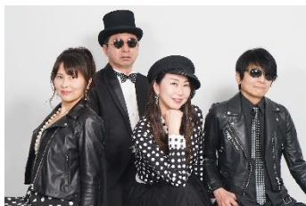
【港区観光大使 REAL VOX】