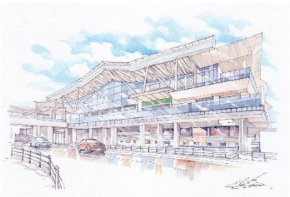
【掲出イラスト例: 高輪ゲートウェイ駅】

高輪ゲートウェイ駅前仮囲いに「高輪ゲートウェイ駅周辺のまちなみ風景」イラストを掲出します。また、掲出されているイラストのスポットを港区観光ボランティアのメンバーと巡ります。さらに、お気に入りのイラストのぬり絵を行い、思い出として残していただけます。ツアー内では高輪ゲートウェイ駅構内の「Partner Base Takanawa Gateway Station」(※通常非公開エリア)で未来の街の模型をご覧ください。