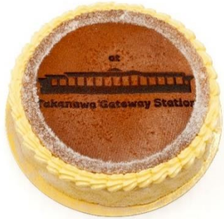
【高輪ゲートウェイ駅限定スフレ イメージ】

当マルシェで高い人気を持つ「帝塚山ぱん士郎」と「代官山シェ・リュイ」が今回も登場。高輪ゲートウェイ駅限定の商品を販売します。