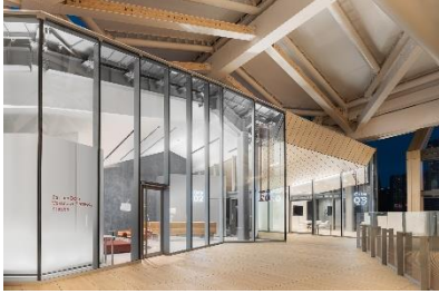
【Partner Base Takanawa Gateway Station イメージ】

高輪ゲートウェイ駅構内「Partner Base Takanawa Gateway Station」(※通常非公開エリア)にて、未来の街の模型や映像の鑑賞とロボット操作体験を組み合わせたツアーを実施します。