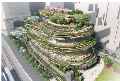
【文化創造棟イメージ】

高輪エリアの中学校・高校において文化系の部活に在籍する中学生・高校生を対象に、「文化創造棟で 100 年先まで開催される総合文化祭」の企画を考えるワークショップを開催します。共創パートナーや高輪エリアにお住まいの方々にも参加を募り、中学生・高校生と同じ目線で企画を一緒に作ります。