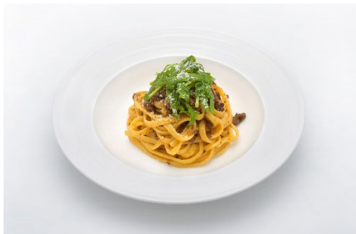
相州牛のボロネーゼパスタ ¥1,800(税込) (パン・ミネラルウォーター付き)