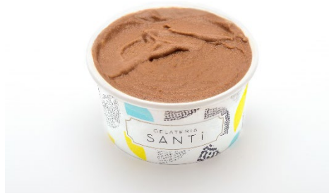
サフィール踊り子オリジナル ジャンドゥーヤ ¥600(税込)

※2022年9月30日で〈伊豆山魚久〉の鯖と小松菜のリングイネ〜カラスミ添え〜、三島マンゴーソルベの提供を終了します。