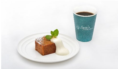
バナナパウンドケーキとソフトドリンクセット ¥1,200(税込) スパークリングワインセット ¥2,300(税込)