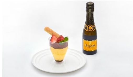
ティラミスとソフトドリンクセット ¥1,200(税込) スパークリングワインセット ¥2,300(税込)