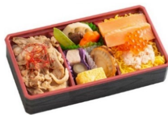
夜食とお菓子（青森駅発・新潟駅行）