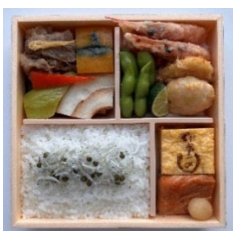
夜食（新潟駅発・青森駅行）

夜食として新潟駅発・青森駅行の車内では新潟料亭「一ノ」の特製弁当、青森駅発・新潟駅行の車内では「津軽づくし弁当」とお菓子「やっこいサブレ・青森りんごキャラメル」をご用意し、夜行列車の旅を彩ります。また、車内での仮眠をサポートするオリジナルの「アイマスク」と「耳栓」をご用意します。夜食やアメニティは、始発駅出発後に各座席へお届けします。