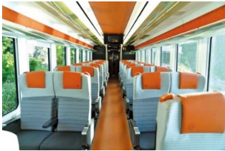
1号車 リクライニングシート

※2号車コンパートメントシートおよび4号車ダイニングは、他のグループと相席になることはございません。