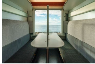
2号車 コンパートメントシート

車両の景観を楽しめるよう座席を窓側に向けた設計としています。広々とした空間でくつろぎながら景観をお楽しみいただけます。