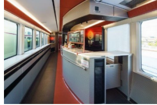
3号車 売店・イベントスペース

全席4人掛けのコンパートメントシートの車両です。座席を引き延ばすことが可能で足を伸ばしておくつろぎいただけます。