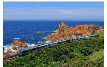
リゾートしらかみ