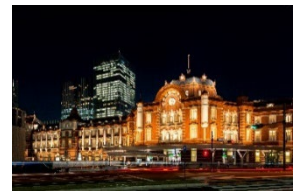
東京ステーションホテル（外観夜景）