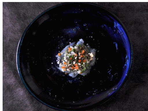
ディナーイメージ（食感カルパッチョ） ※鮮魚は変更となる可能性があります