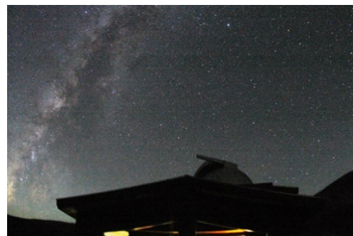
浄土平天文台からの星空