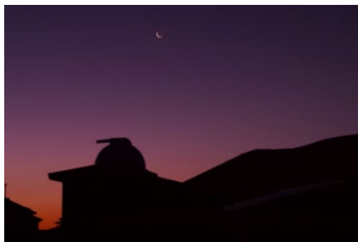
夕暮れの浄土平天文台

雲の上の浄土平は空気が澄み、光害が少ない絶好のスターウォッチングポイントです。天文台スタッフによる星空解説や野外にて福島県在住のプロのヴァイオリン、アコースティックギター奏者による生演奏を行います。時間とともに移りゆく自然を五感で感じていただけます。