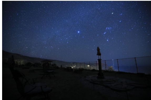
【神津島村 よたね広場の星空】