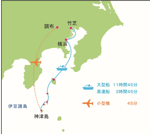
【東京都神津島村へのアクセス】