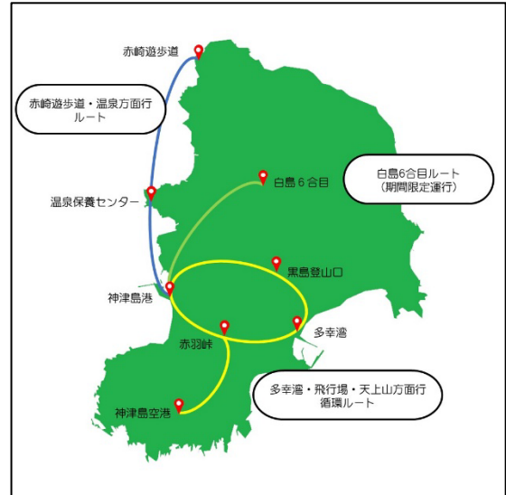
【神津島地図と村営バスルート】

東京都神津島村は、スキューバダイビングやトレッキングなどの観光が盛んで、2020年12月には島全体が星空保護区※に認定され、天体観望でも注目されている伊豆諸島の島です。