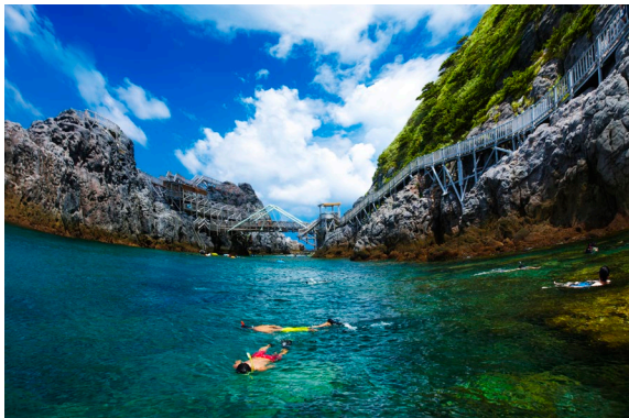
【神津島村 赤崎遊歩道】

東京都神津島村は、スキューバダイビングやトレッキングなどの観光が盛んで、2020年12月には島全体が星空保護区※に認定され、天体観望でも注目されている伊豆諸島の島です。