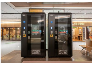
▲ STATION BOOTH仙台(新幹線改札内)