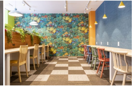
<東海・関西エリア> BIZcomfort 大阪東梅田