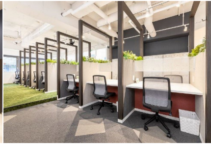
<首都圏・関東エリア> BIZcomfort 池袋西口