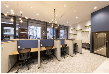
<北海道・東北エリア> BIZcomfort 札幌