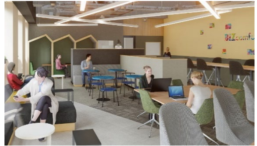
BIZcomfort 千葉西口 イメージ

BIZcomfort 公式サイト： https://bizcomfort.jp/