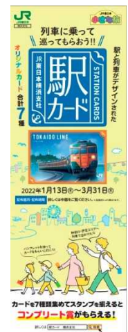
<パンフレットデザイン>