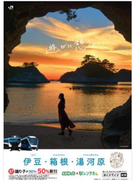
キャンペーンポスター 西伊豆町/乗浜海岸

コンセプト：〈キャンペーン名称「湯どき花どき」について〉 伊豆・箱根・湯河原の早春の代名詞である「温泉」「花」を用いていること、最適な時期を表す「○○どき」と、こころが動く瞬間の「どき」の2つの意味を合わせたものであること、さらにSNSのハッシュタグやWEBの検索ワードとしての汎用性が高いことから選定しました。