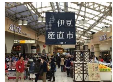
以前開催した時の様子