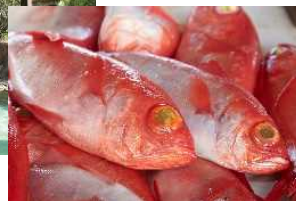
プレゼントイメージ