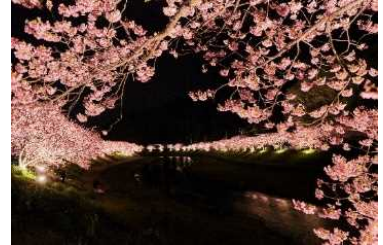
みなみの桜と菜の花まつりライトアップ

貸出施設：ホテル河内屋、季一遊、石花海別邸 かぎや、 壺中の天 宿〇文、花のおもてなし南楽