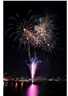
伊東市 花火大会イメージ