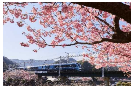
河津桜と「サフィール踊り子」