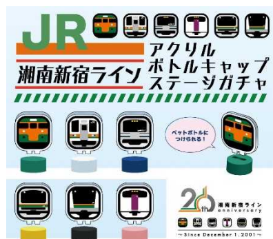
ペットボトルキャップステージガチャ 一回300円