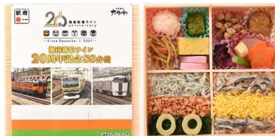
<懸け紙イメージ・記念弁当中身> ※内容等は変更となる場合がございます。

湘南新宿ライン沿線の一部NewDays店舗(12月1日以降準備でき次第) 湘南新宿ライン沿線を含む一部駅弁屋(12月1日以降準備でき次第)