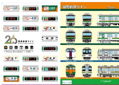
クリアファイル(オモテ面・ウラ面) 300円(税込)