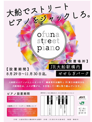
<ピアノ設置箇所概略図>