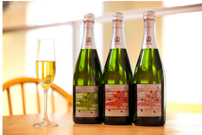
【A-FACTORY アオモリシードル】