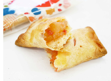
【パティシエのりんごスティック 限定東北ミックス】