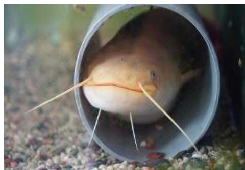
▲黄金色のナマズ「たまずん」

本クイズラリーでは、ゴール地点のカワスイを目指して南武線の駅を巡ります。4つのクイズに挑戦しながら、川崎市を流れる多摩川に棲む生きものや環境、多摩川沿いを走る南武線の歴史について楽しく学ぶことができます。また、本クイズラリーの開催開始日の4月20日より、カワスイでは、多摩川にて発見された黄金色のナマズ「たまずん」を期間限定でご覧いただくことができます。春の暖かいおでかけシーズンに、ご家族皆さままでカワスイや南武線沿線に足を運んでみてはいかがでしょうか。