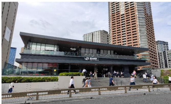
飯田橋西口駅舎・エキュートエディション飯田橋外観

「エキュートエディション飯田橋」公式ホームページ https://www.ecute.jp/edition/iidabashi