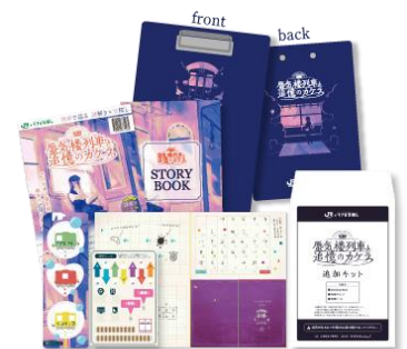
謎解きキット (イメージ)