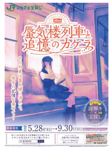
ポスター (イメージ)

※ 販売箇所・時間は変更となる場合がありますので「蜃気楼列車と追憶のカケラ」特設ウェブページにて最新情報をご確認ください。