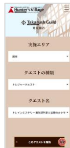
キーワード報告 (イメージ)