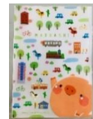
ころとんオリジナルクリアファイル