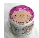
前橋・ころとんオリジナル マスキングテープ