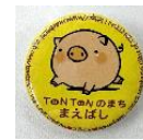
ころとん缶バッジ