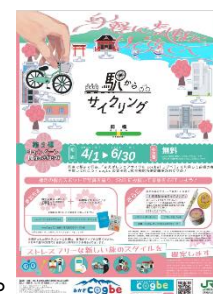
「駅からサイクリング」パンフレット