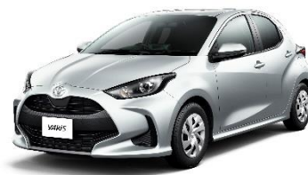
駅レンタカーS クラス車種(イメージ)