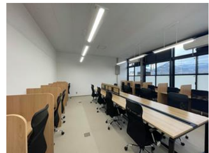
【学習室内部イメージ】