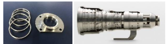
コンプレッサーの精密部品