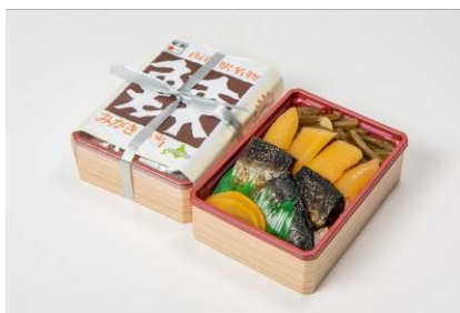
にしん 鯨みがき弁当

厚みのある鯨の甘露煮は骨までやわらかく、お箸でほろりとほぐせます。天日干しの身欠き鯨をみかど秘伝のタレで煮込み、一晚寝かせました。コリコリした歯ごたえの自家製味付け数の子、三陸産茎ワカメの醤油漬はニンニクと唐辛子を隠し味に。昭和41年の発売以来、変わらぬ製法でお届けする一番人気のお弁当です。