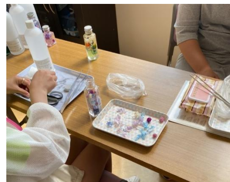
ワークショップイメージ