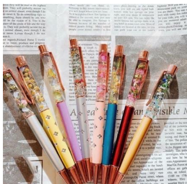
販売作品イメージ