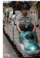
※ミニ新幹線イメージ