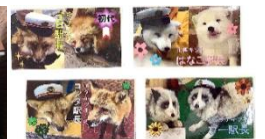
※過去に配布したキツネ駅長カード