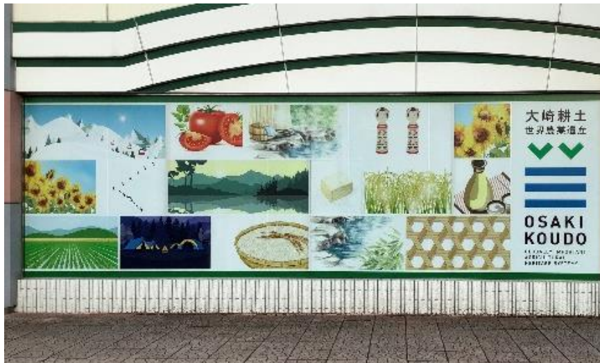
多目的スペース外壁ガラス面

多目的スペース外壁ガラス面には、大崎市の名所や地産品・文化等をイメージした装飾を施しておりますので、古川駅にお越しの際は、ぜひご覧ください。