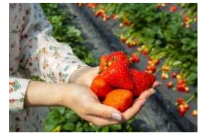
いちご狩り(イメージ)