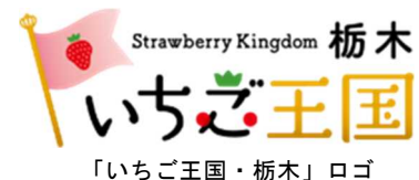
「いちご王国・栃木」ロゴ