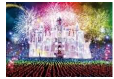
あしががフラワーパーク

歴史ある蔵の街「とちぎ」の散策と2017年に日本三大イルミネーションに認定された、あしががフラワーパーク「光の花の庭」をお楽しみいただけるプランです。