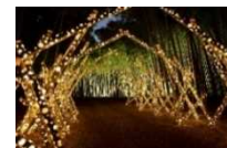
若山農場ライトアップ