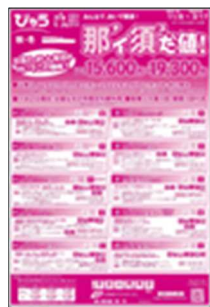
エリア限定お得な宿泊商品