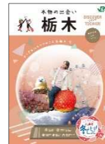
栃木県との共同制作パンフレット

栃木県と共同制作した地元の魅力や観光スポットを紹介するパンフレットを掲出し、本キャンペーンを PR します。