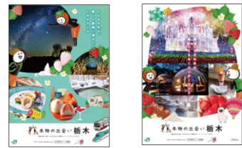
JR 東日本版ポスター 栃木県版ポスター

JR 東日本大宮支社及び栃木県が制作した B1 ポスターやデジタルサイネージにより、本キャンペーンを PR します。