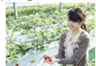
お菓子の城 いちご狩り

那須塩原駅からのレンタカーとお菓子の城那須ハートランドでのいちご狩りがセットになったプランです。那須高原のドライブと「スカイベリー」の食べ放題がお楽しみいただけます。