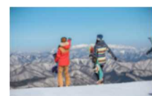
ハンターマウンテン塩原

リフト一日券と那須塩原駅からスキー場までの送迎がセットになった、首都圏最大級のゲレンデを擁するハンターマウンテン塩原の日帰りスキープランです。