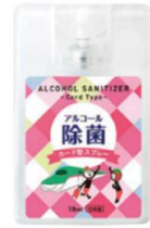
JR東日本オリジナルカード型除菌スプレー（イメージ）

※「本物の出会い 栃木」駅ハイラリーの詳細は、首都圏の主な駅のパンフレットをご覧ください。