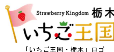
「いちご王国・栃木」ロゴ