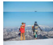
ハンターマウンテン塩原

リフト一日券と那須塩原駅からスキー場までの送迎がセットになった、首都圏最大級のゲレンデを擁するハンターマウンテン塩原の日帰りスキープランです。