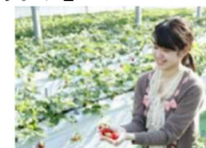
お菓子の城 いちご狩り

那須塩原駅からのレンタカーとお菓子の城那須ハートランドでのいちご狩りがセットになったプランです。那須高原のドライブと「スカイベリー」の食べ放題がお楽しみいただけます。