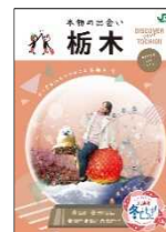
栃木県との共同制作パンフレット

栃木県と共同制作した地元の魅力や観光スポットを紹介するパンフレットを掲出し、本キャンペーンを PR します。