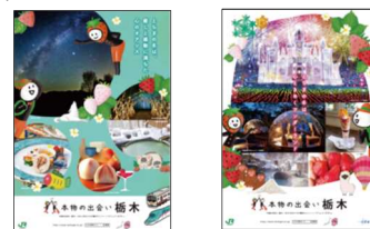
JR 東日本版ポスター 栃木県版ポスター

JR 東日本大宮支社及び栃木県が制作した B1 ポスターやデジタルサイネージにより、本キャンペーンを PR します。