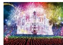
あしががフラワーパーク

歴史ある蔵の街「とちぎ」の散策と2017年に日本三大イルミネーションに認定された、あしががフラワーパーク「光の花の庭」をお楽しみいただけるプランです。