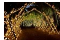
若山農場ライトアップ