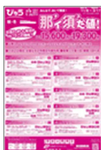
エリア限定お得な宿泊商品