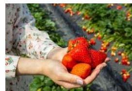
いちご狩り(イメージ)