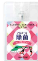
JR東日本オリジナルカード型除菌スプレー（イメージ）

※「本物の出会い 栃木」駅ハイラリーの詳細は、首都圏の主な駅のパンフレットをご覧ください。