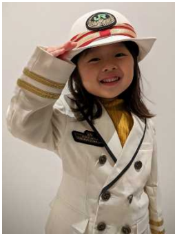
こども駅長制服 (イメージ)