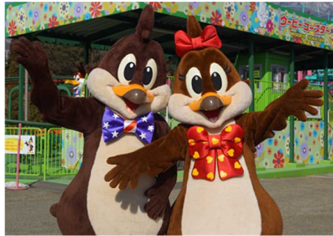
ウーピー・ナッピー