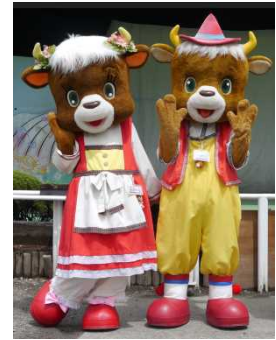
まきばくん・みどりちゃん