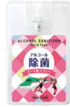
JR 東日本オリジナルカード型除菌スプレー（イメージ）

※「本物の出会い 栃木」駅ハイラリーの詳細は、首都圏の主な駅のパンフレットをご覧ください。