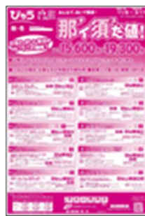
エリア限定お得な宿泊商品