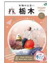
栃木県との共同制作パンフレット

栃木県と共同制作した地元の魅力や観光スポットを紹介するパンフレットを掲出し、本キャンペーンを PR します。