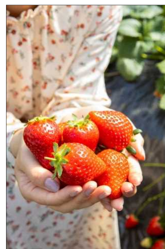
「いちご王国・栃木」のいちご