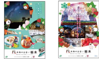
JR 東日本版ポスター 栃木県版ポスター

JR 東日本大宮支社及び栃木県が制作した B1 ポスターやデジタルサイネージにより、本キャンペーンを PR します。