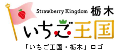
「いちご王国・栃木」ロゴ