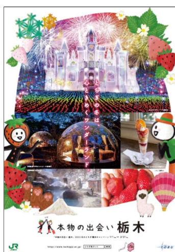
キャンペーンポスター【2種】