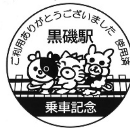
乗車記念スタンプ