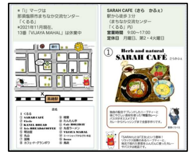
(イメージ) うんめえ〜グルメMAP

2018年から黒磯駅社員が手作りで制作し、配布していた駅周辺の飲食店や和洋菓子・惣菜店を紹介する「うんめえ〜グルメMAP」を環境保護や利便性向上の観点から、装いも新たにスマートフォン版として展開します。駅構内にある二次元コードを読み取ることでペーパーレスにお手元のスマートフォンで16店舗の情報がご覧いただけます。