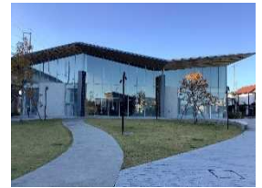
那須塩原市図書館「みるる」

当社社員が東北本線（宇都宮線）で過去そして現在活躍する列車を撮影した鉄道写真を特設コーナーで展示します。