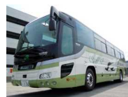
バス乗務員訓練専用車