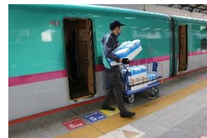
新幹線による輸送の様子