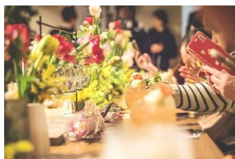
フラワーバレンタイン PR 事業の様子（昨年）

CoCoLo 西 N+内『TABIBAR&CAFE』にて、新潟市産花きの装飾と、花束&お花にちなんだ東京駅で人気のスイーツをセット販売します。（販売時間：10:30～17:00、各日限定 50 セットでなくなり次第終了）