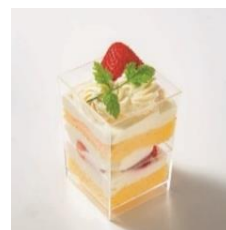
新幹線輸送商品の一例 京橋千疋屋「苺ショートケーキ」 ※新潟県初登場