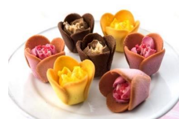
東京駅の人気スイーツ