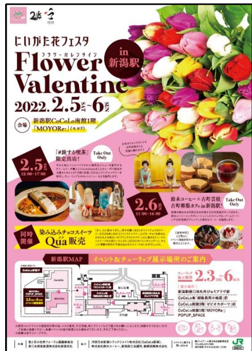
ポスタービジュアル

「古町柳都カフェ in 新潟駅」で商品をお買い上げの方先着 300 名様に新潟駅社員がデザインしたキャラクター「新米芸妓およね」のコースターを差し上げます