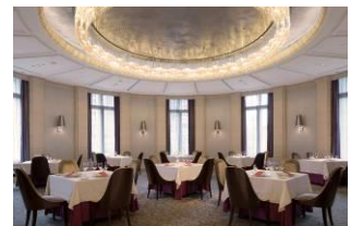
レストラン〈ブラン ルージュ〉