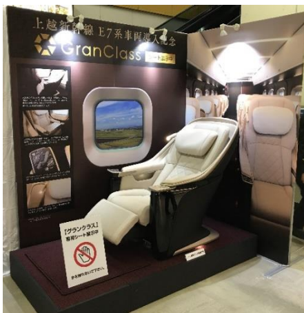
E7系グランクラス専用シート