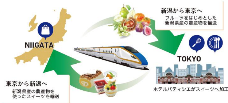
上越新幹線を使った東京・新潟間の輸送イメージ

新潟県が誇るフルーツをはじめとした農産物を広くPRしていくことを目的とし、上越新幹線による高速輸送を活用した東京・新潟でのイベントを実施します。新潟から東京へは、季節のフルーツを中心とした、県産の農産物を東京へ輸送し、東京ステーションホテルのパティシエがスイーツへ仕立て、ホテルレストランでご提供します。合わせて、ホテル製の限定スイーツを東京から新潟へ輸送し、催事販売を行います。