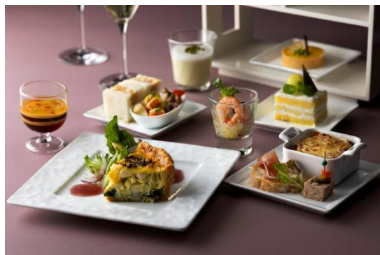
トワイライトハイティー (イメージ)

店舗詳細: https://www.tokystationhotel.jp/restaurants/lobbylounge/