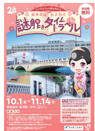
イベントポスター イメージ