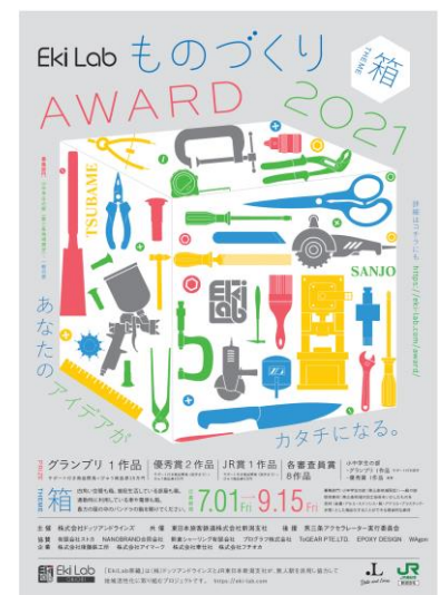
ポスター イメージ

審査結果の発表は11月上旬を予定し、表彰式とグランプリ受賞作品の製品公開は2022年3月下旬を予定しています。