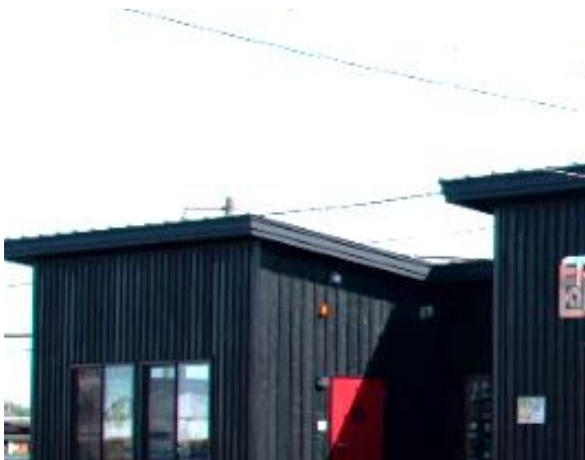
EkiLab 帯織 外観 (一部)