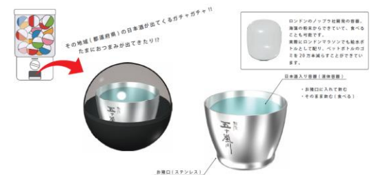
応募時アイデアシート

お酒は飲み過ぎると酔っ払って、寝てしまったり、体調が悪くなったり、何が出てくるか「ドキドキ」して、どんな味なのか「ワクワク」しながらお酒を飲む。そんなお酒をガチャガチャで出し、何が出てくるか「ドキドキ」して、どんな味なのか「ワクワク」しながらお酒を飲む。買ってその場で飲むもよし!! 電車の中で飲むもよし!! たくさん買って飲み比べもよし!! 誰のちよっとした「楽しみ」の瞬間です。