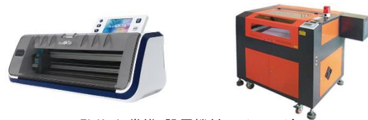
EkiLab 帯織 設置機材 イメージ