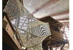
森の駅 Daiza houshi 屋内アクティビティ

森の駅 Daiza houshi====防災メモリアル地附山公園====長野駅（16：45頃着）