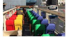
オープントップバス（座席）