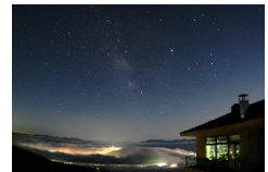
高峰高原からの星空