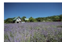
夢ハーベスト農場

・夏でもさわやか高原めぐり午前Bコース（6月～8月運行） 軽井沢駅（9：00発）====夢ハーベスト農場====高峰高原 ====小諸駅（12：35頃着）====佐久平駅（14：10頃着）