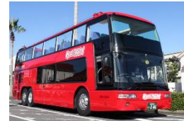
オープントップバス

また、カラフルなレザーシートにより華やかな気持ちでご旅行をお楽しみいただけます。