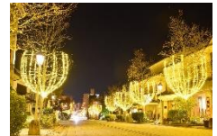
善光寺表参道イルミネーション

長野駅（19：30発）====防災メモリアル地附山公園====長野駅（20：40頃着）