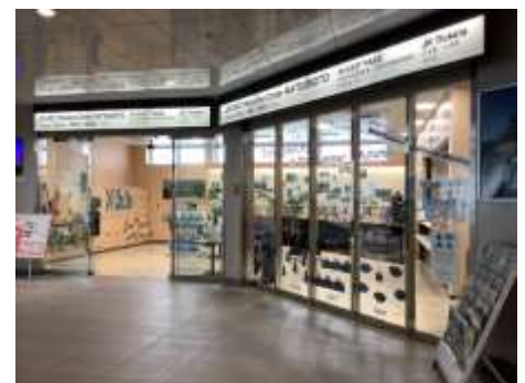
▲JR EAST Welcome Center MATSUMOTO