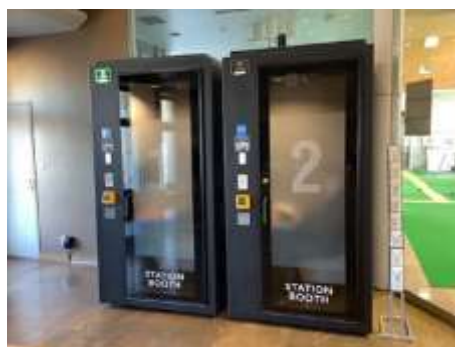
▲STATION BOOTH イメージ