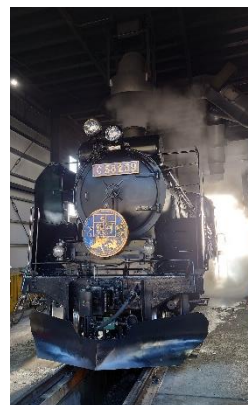
↑ SL 検修庫内見学(イメージ)