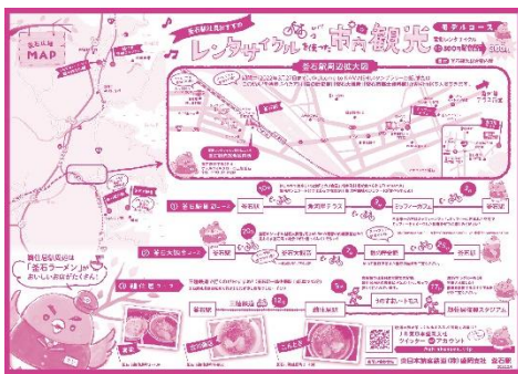
釜石駅社員おすすめサイクリングコース

期間中にスタンプ台紙またはサイクリングマップをお持ちいただいたお客さまは、釜石観光総合案内所の電動レンタサイクル料金をお得な料金（通常1日500円のところ300円）でご利用いただけるほか、「鉄の歴史館」「釜石大観音」「釜石市郷土資料館」が割引価格で入場できます。