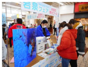
前回の岩泉フェア開催時の様子(2020年2月)