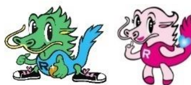
【岩泉龍泉洞 PR キャラクター】