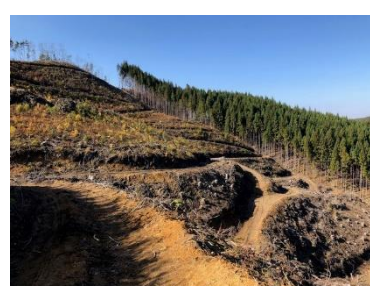
植樹作業地(上米内)