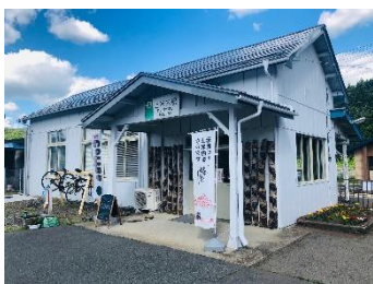
上米内駅舎外観(設置前)