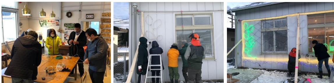
イルミネーション設置までの作業の様子

※イルミネーションの点灯時間に合わせたの駅舎内の延長営業は行わず通常営業時間の18:00までです。