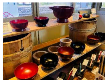
上米内駅舎内 漆関連品の展示