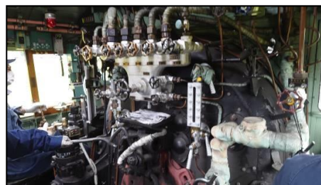
↑ SL 運転台(イメージ)