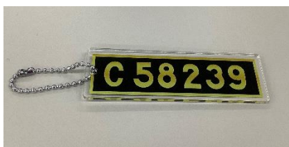
↑ オリジナルキーホルダー(イメージ)