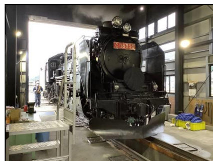
↑ SL 検修庫内見学(イメージ)