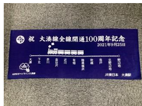
100 周年記念注染てぬぐい（イメージ）

※ 駅係員が別業務に対応している際は、プレゼント交換をお待ちいただく場合がございます。