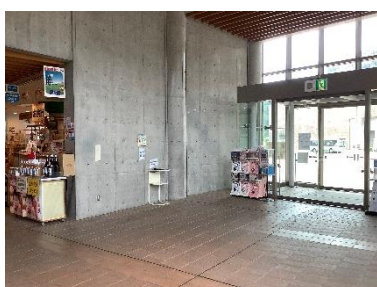
三内丸山遺跡センター縄文時遊館