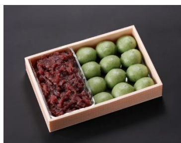
※ 写真はイメージです

米は特選の「コシヒカリ」を、毎日使う量だけ粉をひき、もち草は筑波山麗の澄んだ空気のもとに育んだ「よもぎ」のやわらかい新芽をつみ、あんは北海道産の一級の小豆をつかい上品な甘さに仕上げております。添加物を一切使用していない自然食品です。