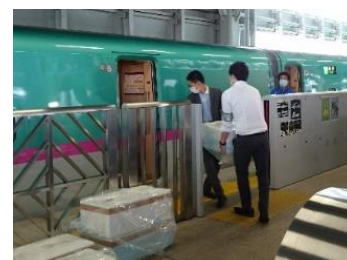
※ 写真はイメージです