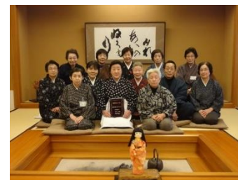
遠野昔話 語り部の会(イメージ)

往路の遠野～釜石間に地元「遠野昔話語り部の会」の方が乗車し、車内で遠野の昔話を語ります。