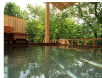
露天風呂の一例(イメージ)