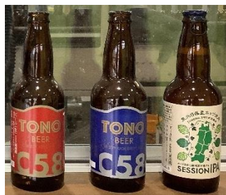
遠野商品一例(イメージ)