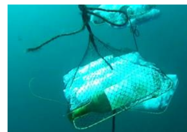
恋し浜海中貯蔵酒(海中での貯蔵イメージ)