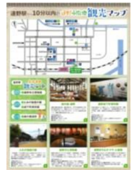
まち歩きマップ(イメージ)