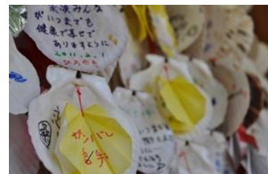
恋し浜駅ホーム待合室内 ホタテ絵馬(イメージ)