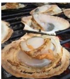
焼きほたて(イメージ)