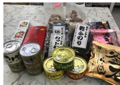
釜石商品一例(イメージ)