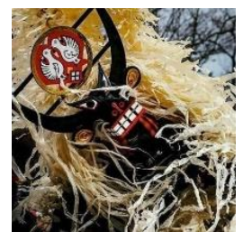
しし踊り(イメージ)