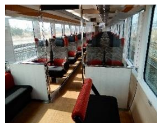
リゾートあすなろ車内