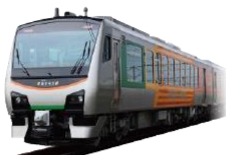
車両外観(イメージ)