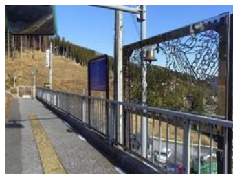
恋し浜駅ホーム上 幸せの鐘(イメージ)