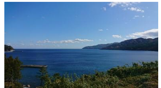
三陸鉄道 吉浜駅付近からの車窓(イメージ)

運転区間の中でも眺望の良い三陸鉄道吉浜駅付近では速度を落として走ります。車窓から広がる三陸リアス海岸の景色をお楽しみください。