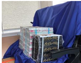
輸送荷姿イメージ