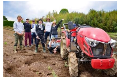
とうもろこし栽培を手伝う水戸駅社員