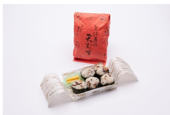
「そば屋の天むす」1個 750円(税込) 限定55個

にんにくをきかせた特製しょうゆたれで味付けした鶏もも肉を揚げたボリュームたっぷりの満足弁当です。