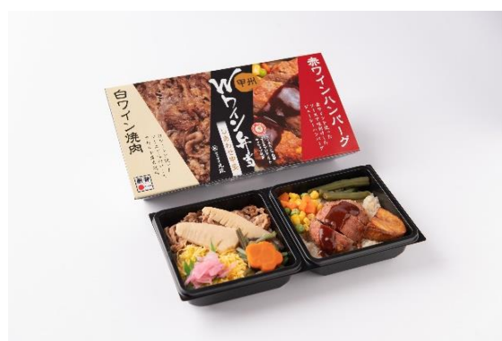
「甲州Wワイン弁当」1個 1,100円(税込) 限定55個

甲斐サーモンのマリネや、甲州ほうとうグラタン、甲州鳥もつ煮など食事だけでなく、ワインのお供にも合う駅弁です。