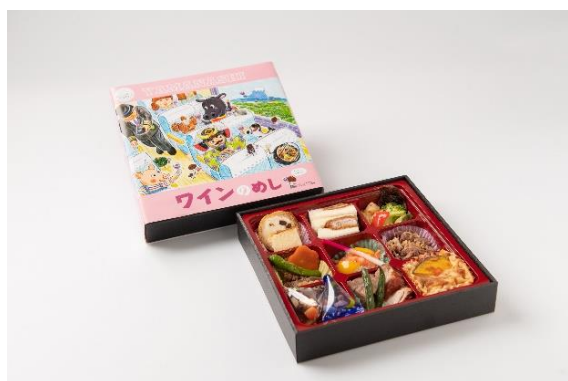
「ワインのめし」1個 1,500円(税込) 限定183個

甲斐サーモンのマリネや、甲州ほうとうグラタン、甲州鳥もつ煮など食事だけでなく、ワインのお供にも合う駅弁です。