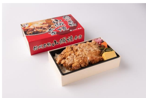
「信州名物山賊焼弁当」1個 980円(税込) 限定55個

赤ワインソースのハンバーグと、白ワインソースの炭火焼肉をお楽しみいただけるWワイン弁当です。